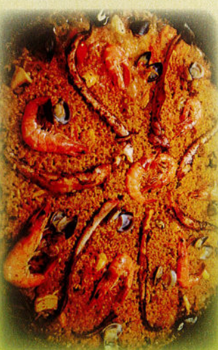
Kuva: Pop up -ravintola Casa Paco

facebook-sivuilta. Ryhmille myös muulloin.