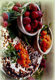
Kuva: Hotelli Kalevala

oman järven kuhasta ja muita herkkuja uusitusessa kesämenussai