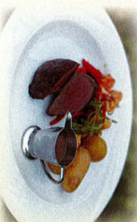
Kuva: Piharavintola Lappi